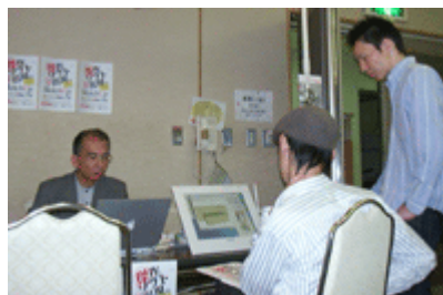
ムービーはこちら