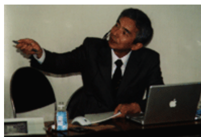
ムービーはこちら

唯一機械系の実践セミナーの講師として、大阪キャラバンの再演をお願いしました。プラントや細かな什器の設計、テクニカルイラストを長年手掛けられ、機械設計でVectorWorksを利用されていますが、分割線の陰線消去では大変ご苦労されてきました。今回のバージョンアップではその陰線消去が可能になり、使い勝手が格段によくなったと、その細かなテクニックを披露してくださいました。台風の最中、心配しながらの広島入りでしたが、ゆったりとしたとてもわかりやすい内容でした。(ご本人は、持ち時間内での内容整理は大変だったそうです)そして、ご自身で得たWebサイトのデータ情報をみなさんにもお教えくださり、参加者の方は熱心にメモを取っていました。参加者の方も大雨の中の受講でしたが、得た気分で笑顔が一杯でした。