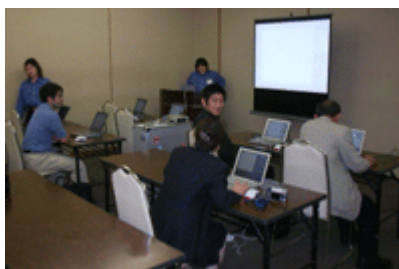
ムービーはこちら

初日の夜から雨が降り始め、2日目は朝から大雨、飛行機が欠航しているニュースで目がさめました。台風が再上陸とのこと、帰りの便があるか、もう1泊を覚悟でオープンしたものの、お客さまが来ていただけるか心配でした。いや～みなさん熱心でびっくりです。ビショビショの傘をもって、セミナー会場へ入られます。用意した席はすぐに一杯。山口や岡山からも見えられ、ノートを広げて受講されました。今回地元広島ユーザーさんの実践セミナーはありませんでしたが、次回是非受講されたユーザーさんのセミナーをお願いしたいと思います。広島のみなさんよろしく申し上げます。