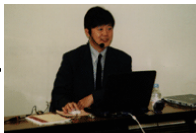
ムービーはこちら

今回の実践セミナーの講師のお願いに1番乗りで手を挙げていただきました。大学の教壇を離れて故郷の岡山へ戻られてから早2年。きっと、たくさんのことを思い留めてこられたことでしょう。なににもよらず、プレゼンテーションの必要性を十二分にお話しくれました。ご自身のパソコン歴、CAD歴に加え、さまざまな情報を取り寄せ、その活用事例をたっぷり披露してくださいました。参加者はその情報だけでも大きな収穫となりました。それらの情報を流動的に使いながら、独自の建築思考の上にたったの実施プランの紹介は「見せる」「説得する」テクニックの実践セミナーでした。70分の時間をドンピシャリで終られたのには驚きでしたが、スタデからプレゼンテーションまでのアイデアの数々は、再度整理して伺いたい内容でした。次回は、メモの用意をして参加したいですね。