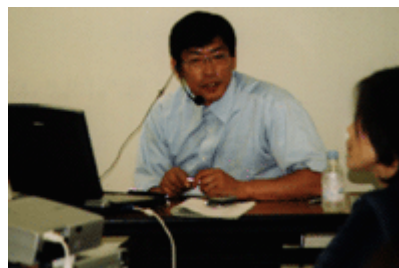
ムービーはこちら

施主には最初の段階でプランをしっかりと提示するため、RenderWorksも同時に使用しながら、ライティングや外溝廻りも描きます。その仕上げプランには時間を要しますが、結局はあとの作業が格段と時間短縮に繋がり、効率第1のCAD利用は、「イメージを施主に伝える手段として欠かせない道具になっている。」とのことでした。山口から前日入りされ、緊張な面持ちのセミナーでしたが、やさしいお仕事ぶりがほのぼのと感じられるセッションでした。